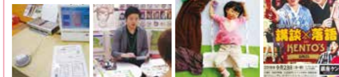
●血管年齢イベント ●似顔絵イベント ●おひるねアート ●楽活イベント