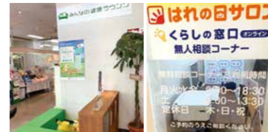
▲シニアに寄り添うための調剤薬局に出店「みんなの健康ラウンジ」